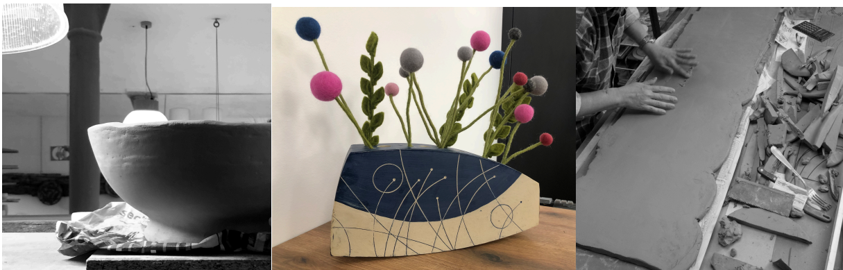
* Alle abgebildeten Keramiken sind Ergebnisse der Teilnehmer eines Workshops bei annTON Atelier.