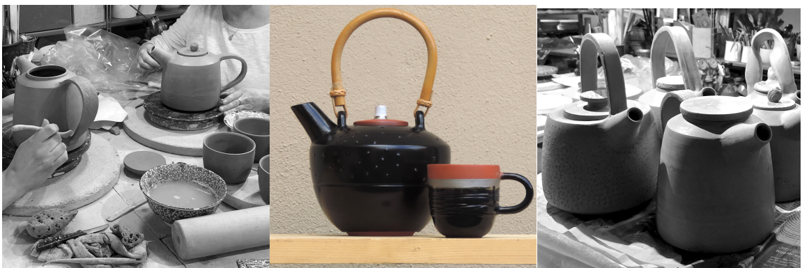
* Alle abgebildeten Keramiken sind Ergebnisse der Teilnehmer eines Workshops bei annTON Atelier.