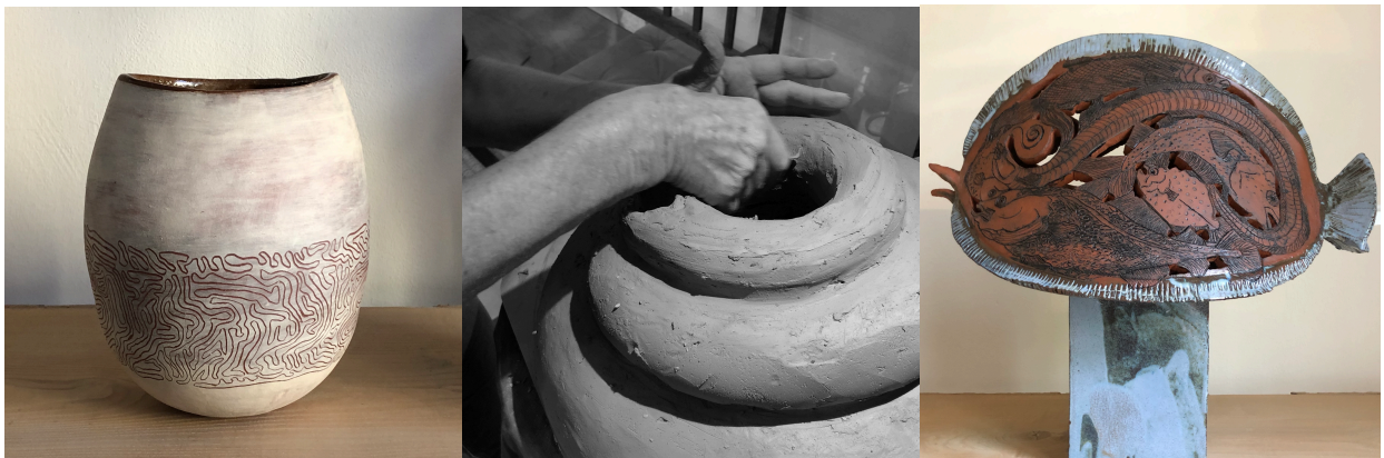
* Alle abgebildeten Keramiken sind Ergebnisse der Teilnehmer eines Workshops bei annTON Atelier.